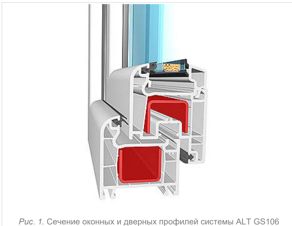
Рис. 1. Сечение оконных и дверных профилей системы ALT GS106

Система термоизолированных профилей ALT GS106 является идеальным решением для установки подъемно-сдвижных оконных и дверных конструкций в отелях, ресторанах, а также в частных домах и коттеджах. Благодаря отличной функциональности система предоставляет широкие возможности архитекторам и дизайнерам при оформлении больших стеновых проемов.